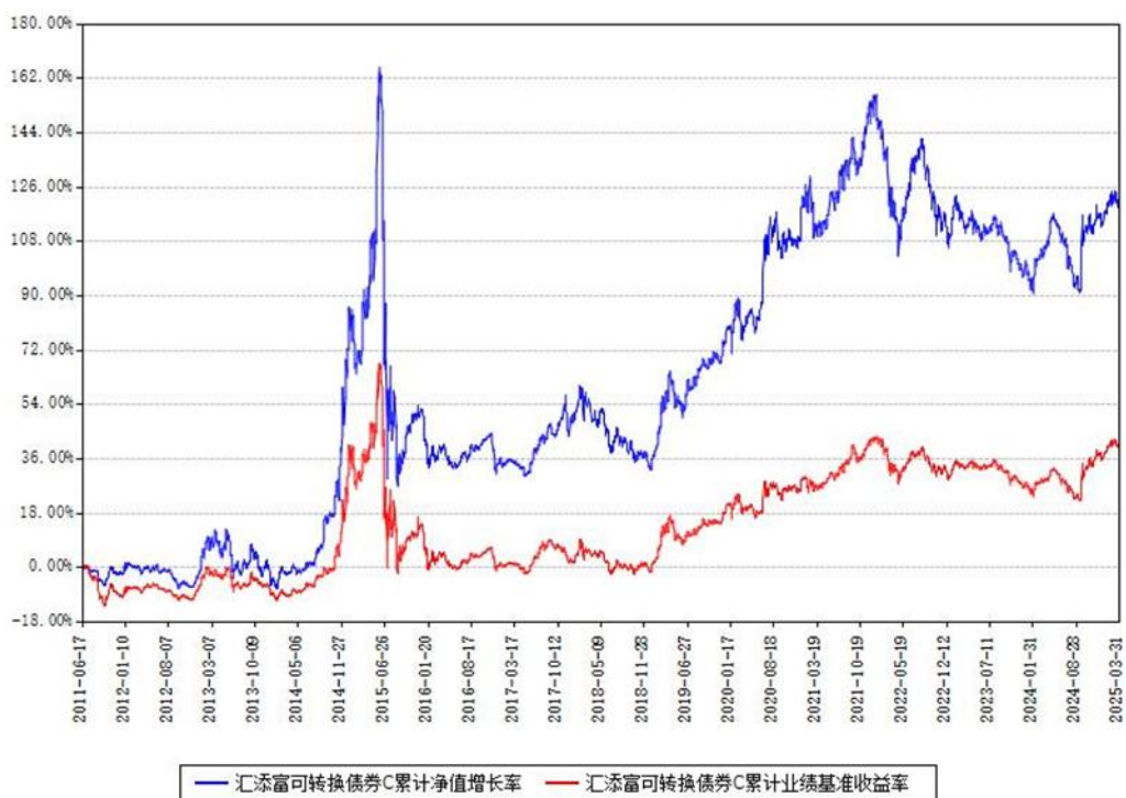
汇添富可转换债券C累计净值增长率与同期业绩基准收益率对比图