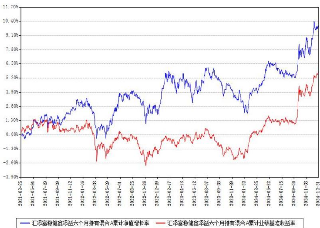
汇添富稳健鑫添益六个月持有混合A累计净值增长率与同期业绩基准收益率对比图