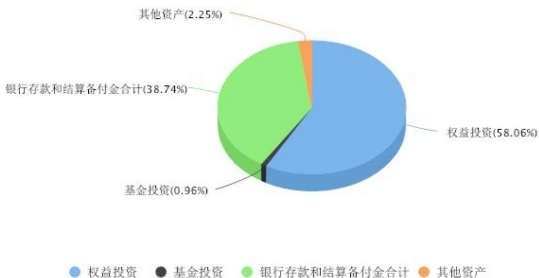
区域配置图表 数据截止日期:2024年06月30日