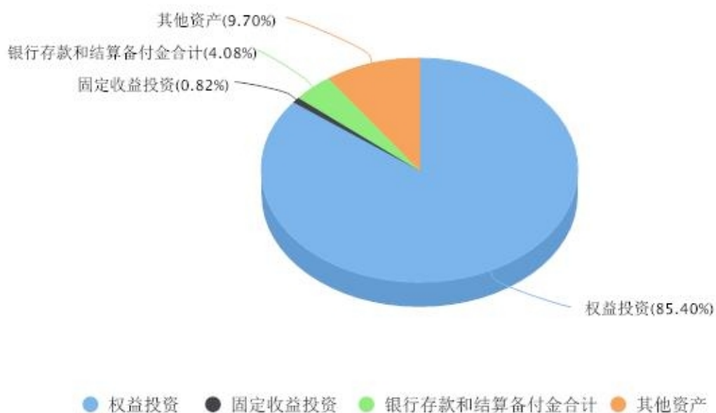
投资组合资产配置图表 数据截止日期:2024年09月30日